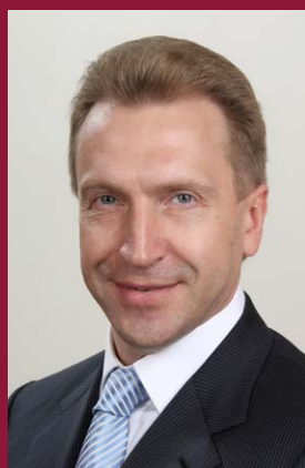
ШУВАЛОВ ИГОРЬ ИВАНОВИЧ Председатель